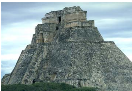
600 metros de altura