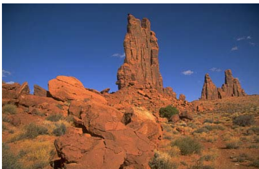
450 metros de altura